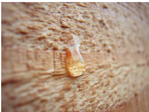
WoodCare® is waterwerend

WoodCare® maakt het mogelijk dat het natuurlijke karakter van hout tot uiting komt. WoodCare® bevat fixerende waterafstotende stoffen, ontwikkeld met behulp van nanotechnologie. Deze zorgen voor een hoogwaardige bescherming tegen weersinvloeden. Schimmelvorming wordt voorkomen dankzij een combinatie van UV-filters en natuurlijke bindmiddelen. WoodCare® zorgt voor een zeer gelijkmatige veroudering van het hout.