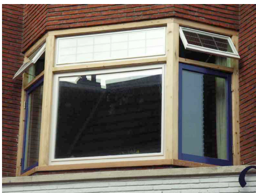
WoodCare® met SunCare® toont het grenen van de originele kozijnen uit de jaren '30 (Groningen, Blekerstraat)